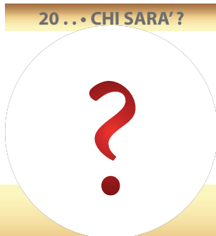
20... CHI SARA' ?