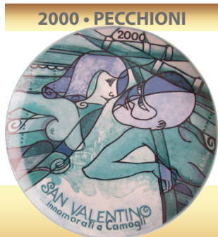
2000 • PECCHIONI