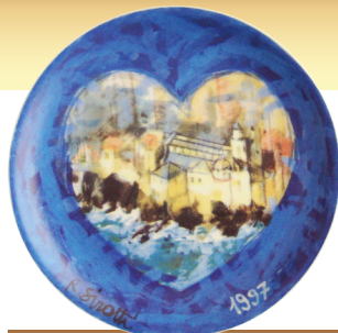
1997 • SIROTTI