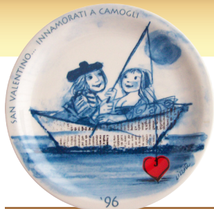
1996 • LUZZATI